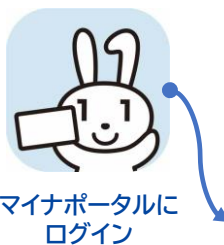
マイナポータルにログイン